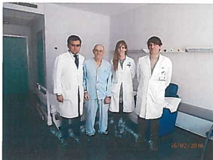
PEPE operado de aneurisma encontrado en el screening del Camino de Cervantes