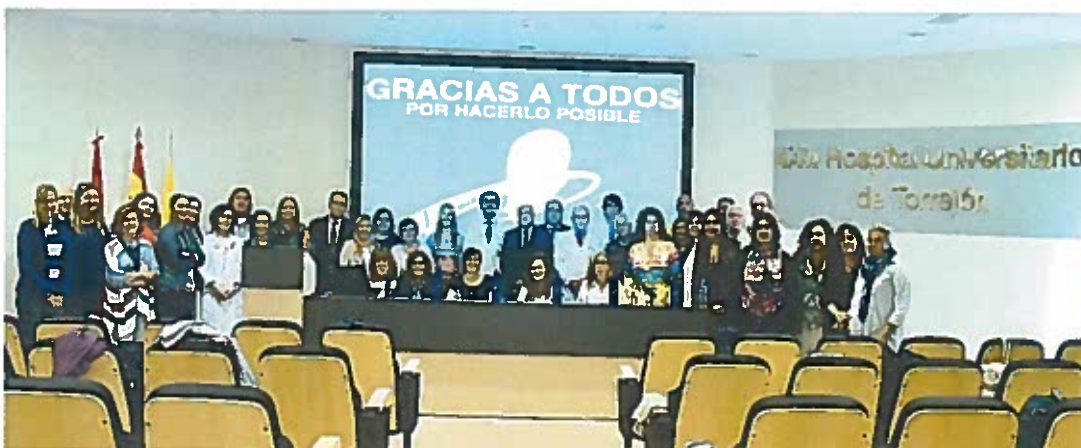
Foto presentación en Hospital de Torrejón día 1 de Septiembre 2016

Día 1 de septiembre se realizó la presentación oficial a todos los Ayuntamientos y Asociaciones de pacientes